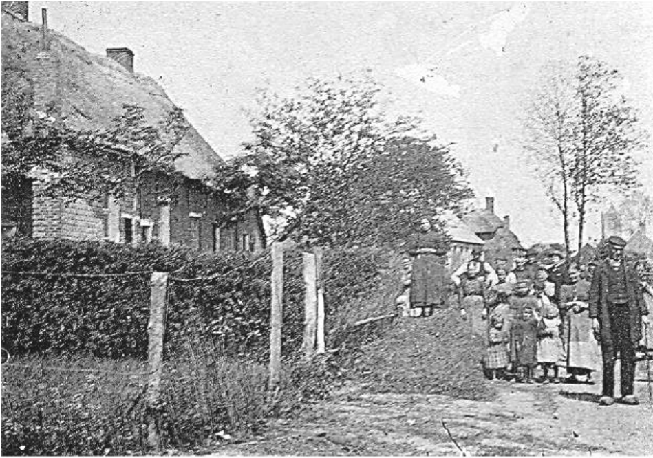
Moll. - Berg. - Genebroek.