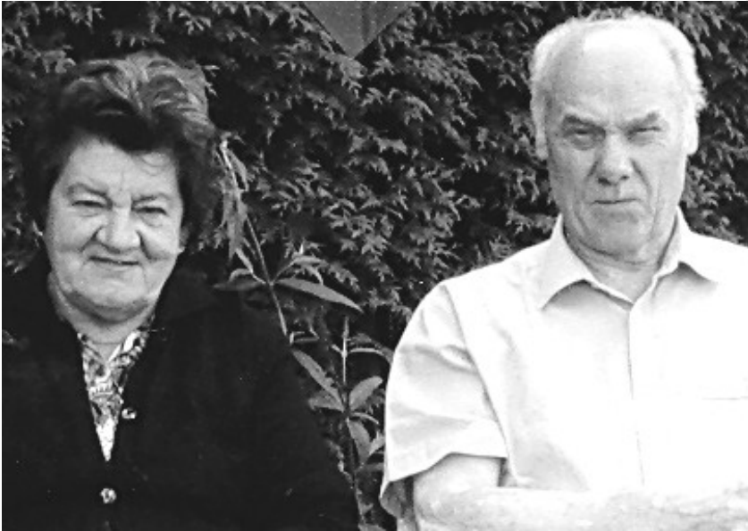
8 oktober 2008, diamanten bruiloft

Nadat hij getrouwd was, is hij achtereenvolgens gaan werken in de koolmijn van Zolder, in de houtzagerij van Vanderhoydonck, in Fheniks Works in Flémalle Haute en in de zinkfabriek Vieille Montagne, maar vanaf 1 juli 1953 werd hij beroepsmilitair bij het Belgische leger, tot hij in 1983 met pensioen ging.